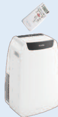
Dolceclima Air Pro 14