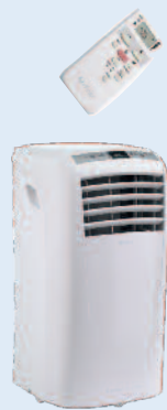
Dolceclima Compact 9P