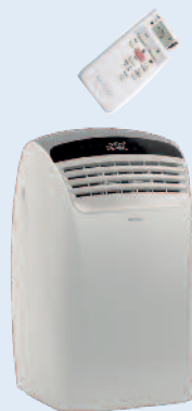
Dolceclima Silent 12P