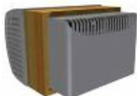
Wine C25 & C25S Außenansicht