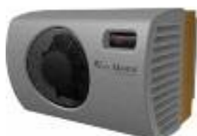
Wine C25 & C25S Innenansicht