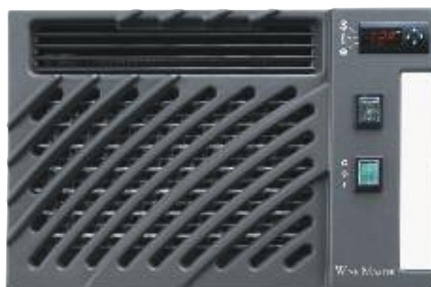
Wine C50S Innenansicht