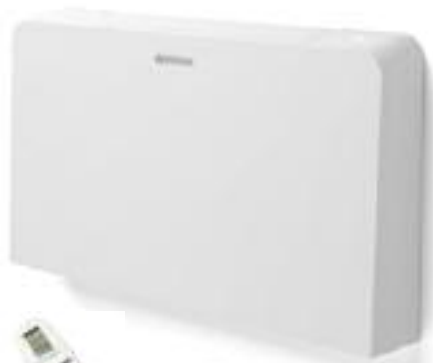
Design by S. Ercoli & A. Garlandini

Analoge Steuerung zur universellen Fernsteuerung (per 0-10 V oder digitaler Signalübertragung mit 4 Geschwindigkeiten).