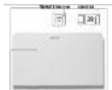
AR Steuerung inkludiert