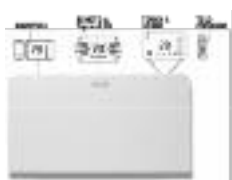
TR Steuerung inkludiert