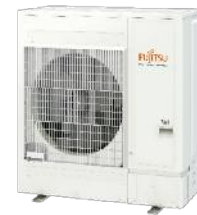
AOYG45/54KBTB / KRTA