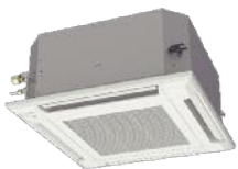
Kompakt Kassette KVLA

Es werden 2 Innengeräte mit insgesamt 6 Modellen angeboten, sodass Sie je nach Raumgröße und -bedingungen auswählen können.