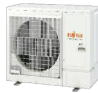
AOYG36KBTB / KRTA