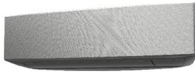
ASYG* KETF-B - Silber