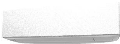
ASYG* KETF - Weiß