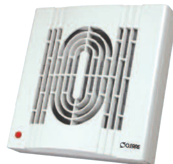
ín 100 A

Nehmen Sie das im Ø passende Fensterkit und Sie haben den ín -Fensterventilator !