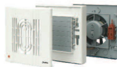
ín 100 A