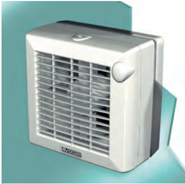
Punto mit Fenstereinkaufkit

Aus jedem Punto wird durch das Fensterkit ein vollwertiger Fensterventilator !